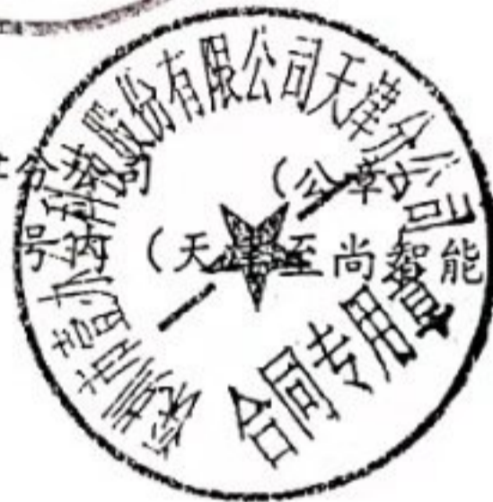
附件1 合同商品清单 单位:元